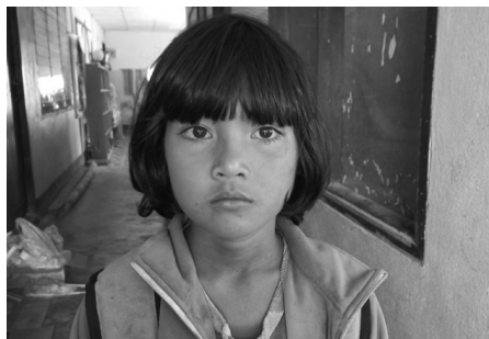
Muechi llega al alojamiento y escuela ITDF Ma Oh Jo.