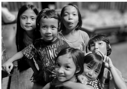
Muechi tiene éxito en el alojamiento y fuera de él!